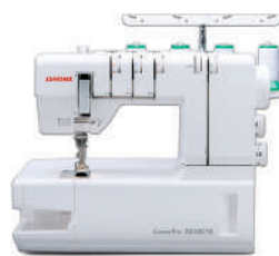
CoverPro 7 PLUS