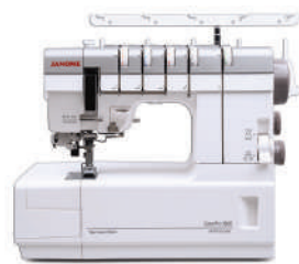
CoverPro 3000 Professional